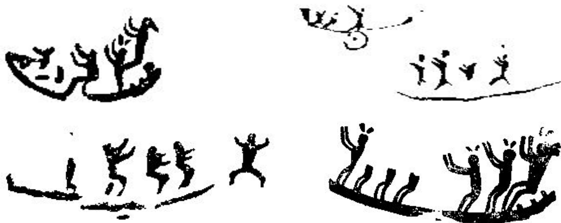
图5 祀河图(广西左江岩画)

岩画中的祀河图见诸于广西左江的岩画。岩画中的船图比较短小，其上只有数个侧身人，说明此类小船只适宜在内陆江河湖泊行驶，应属须虑、舸、轻舟之类小船，狭长而容人不多，利来往江河间。《岭外代答》云：“广西江行小舟，皆剡木为之，有面阔六、七尺者……钦州竞渡兽舟，亦剡全木为之。” ② 宁明花山岩画有很多地点都发现了龙舟竞渡图，船上一般数人，侧身，曲肘举手，半蹲腿，动作一致，似歌舞又如奋棹击水。有一幅船图尤其逼真：船尾立两根小木棒似的的东西，头似鸟形，所谓“龙舟鸱首，浮吹以娱”。船上共有五个侧身人，伸手曲腿，做划桨状。还有一幅画面共有二条船，前后排列。其中最前面的一船之首，似有饰物，舷边挂一铜鼓。每船数人，皆侧身，手前伸，腿稍弯曲，动作一致。船前后两端（似乎在岸边）各有一群舞者，场面隆重而热烈。这些画面与骆越人祀河习俗有关，反映了骆越人崇拜河神的意识，可以称为“龙舟竞渡祀河图”。