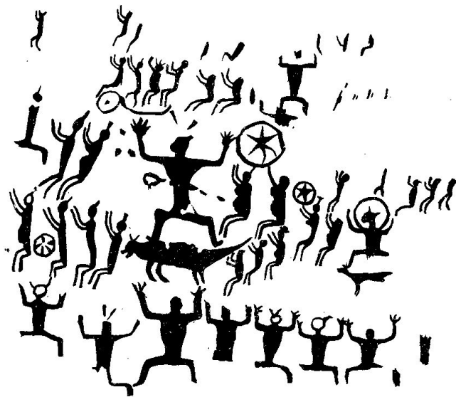
图4 蛙神图(花山岩画)

花山岩画首先映入眼帘的是那种四肢叉开两腿下蹲人物的姿态,这是青蛙的形象,青蛙是人类的农作物的“保护神”,有了青蛙捕捉害虫,庄稼才能得以丰收,显然远古时期的左江先民就已经认识到这点。他们潜意识里认为这是上天派来的蛙神来保护他们的,因此逐渐对青蛙产生了图腾崇拜。在当地至今还流传有“青蛙皇帝”的神话故事。广西有不少以蛙声卜天气的农谚,如“青蛙呱呱叫,暴雨就要到”等,正因为青蛙有如此本领,民间才以为它能呼风唤雨,与天神有关系。