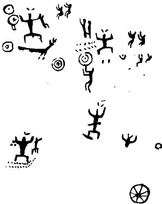
图3 谷穗图(花山岩画)

农作物图像在广西左江岩画中发现两处,见于宁明花山第一区第六组及第二区第三组岩画中,绘于人像的下方。由两排密集的椭圆状点排列面成谷穗状,这是粮食作物的图案。骆越民族为农业民族。从桂南地区及左江流域分布密集的新石器时代晚期的“大石铲”遗址及钦州那丽独料遗址出土的锄、铲、犁、刀、镰、磨盘、杵等石制的农业工具和谷物加工工具来看,骆越先民从事原始农业生产已有悠久的历史。“楚越之地,地广人稀……火耕水耨”,至战国、秦汉之时,农业已较为发达。《水经注》引《交州外域记》说:“交趾昔未有郡县之时,土地有锥田,其田从潮水上下,民垦食其田。” ③ 说明在秦汉以前,骆越人已以耕种水田为生。据史籍所载海南岛“种禾稻”来推测,岩画中的作物大约是“禾稻”类作物。