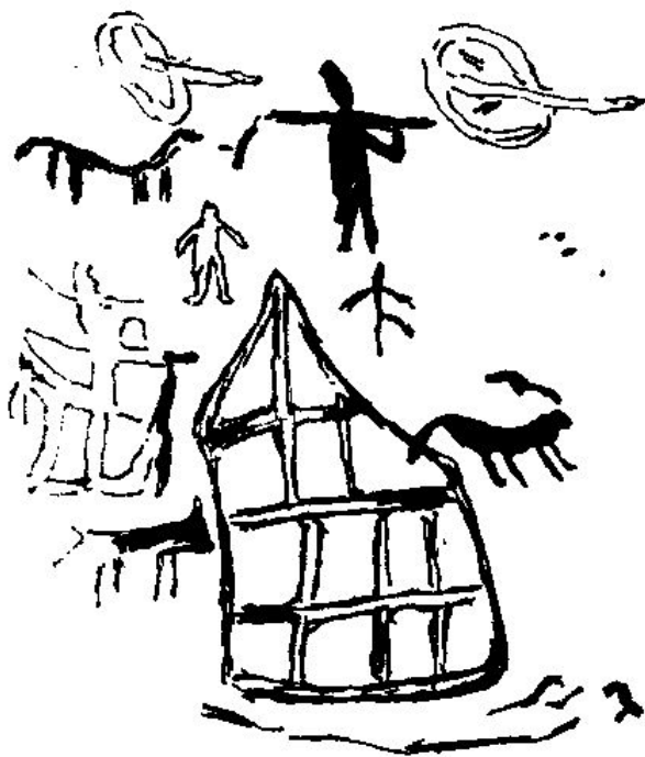
图6 荷锄农夫与田畴图(贵州长顺傅家院岩画)

事实上,贵州这块土地上很早便有了较为发达的农耕文化。《史记》中所记载的夜郎之民是“椎髻、耕田、有邑聚”。从历史上看,古夜郎的中心地带在今盘江(古称豚水)流域。而盘江流域曾先后是古代濮人和布依族人的祖先聚居的地区。贵州考古学界曾在这一地区发掘出一些与耕作文化有关的器物,这批文物中有青铜犁、锄和铁制的锄、铤、铲等适用于稻田耕作的农具。更说明问题的是在发掘出的汉代青铜器物中有一件便是一具完整的稻田模型。这与《史记》的记载互相印证,说明这一地区古代便生活着种植水稻的农业民族。